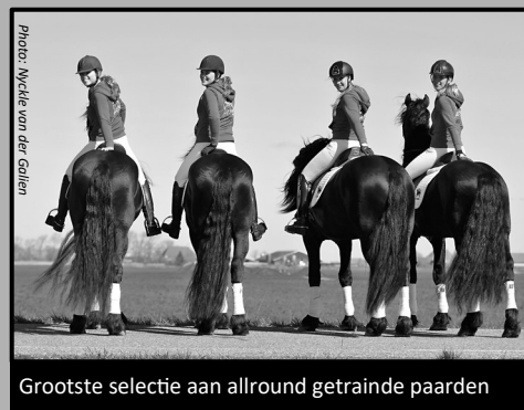
Grootste selectie aan allround getrainde paarden