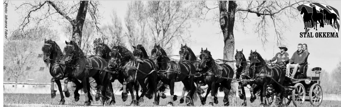
Anne Okkema met een 10 span friese hengsten!